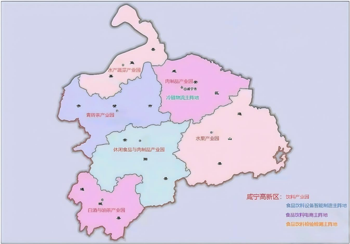
图 2 咸宁市食品饮料产业空间布局

构建六大产业的空间格局布局,通过科学规划各产业的地理分布和功能定位,实现咸宁市食品饮料产业资源的优化互补与产业链条的高效衔接,从而促进形成协同联动、优势互补的产业集群发展态势,提升整体产业竞争力和区域经济活力。